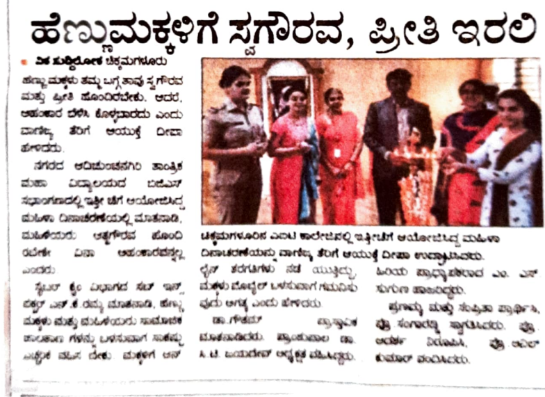
Article published in the paper about woman's day celebration